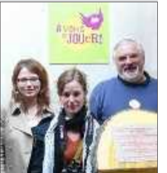
> En page 8