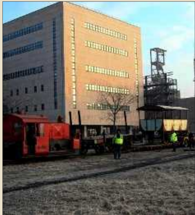
L'activité du train fait débat entre bénévoles et syndicat.

Le dialogue passe mal entre les bénévoles du train et les responsables du syndicat du musée de la Mine à Petite-Rosselle. Le week-end dernier, les cheminots ont laissé leurs bleus aux vestiaires. Gérard Bruck, le président, rassure mais rappelle que le train ne deviendra pas un "train touristique". L'objectif aujourd'hui est la réalisation du cœur du musée et la rénovation de la salle des pendus, la lampisterie et les douches. Un projet en attente depuis longtemps.