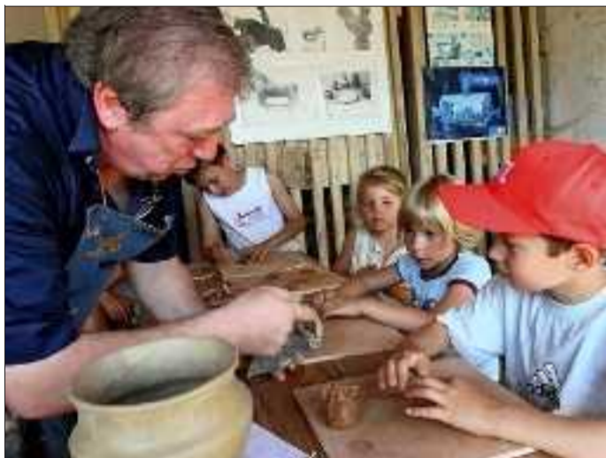
Trois ateliers d'apprentissage seront mis en place.

Le Parc archéologique organise la fête des enfants dimanche de 10 h à 18 h. Les jeunes âgés de 4 à 12 ans sont invités à découvrir les activités qui occupaient les enfants de l'époque gallo-romaine. Ils pourront apprendre à déchiffrer l'écriture romaine ou à réaliser des tissus en laine. En observant le jardin, ils vont repérer les légumes et les plantes aromatiques nécessaires à la cuisine. Les gourmands pourront préparer la pâte à pain et découvrir comment faire de la cuisine romaine, où goûts salés et sucrés se mélangent, sans sel et sans sucre.